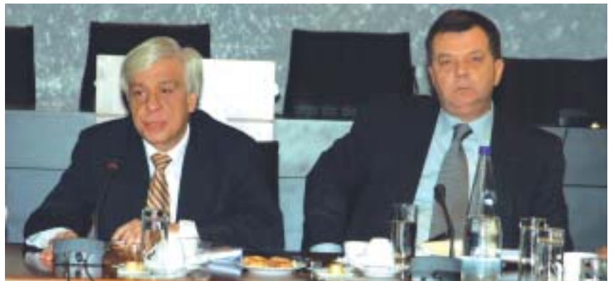
Ο υπουργός Εσωτερικών κ. Προκόπη Παυλόπουλος και ο υφυπουργός κ. Παναγιώτης Χηνοφώτης

Στο ενιαίο Υπουργείο Εσωτερικών, η συστράτευση όλων των φορέων του, από τους Οργανισμούς Τοπικής Αυτοδιοίκησης, έως το σύνολο των ένστολων Σώματα, αποτελεί πλέον πραγματικότητα και η διεύρυνσή τους είναι για μας προτεραιότητα.