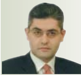
Του Άγγελου Α. Τσιγκρή Πολιτευτή Αχαΐας της ΝΔ

Η κάθε κοινωνική οργάνωση έχει την εγκληματικότητα που της αξίζει. Οι δείκτες διακύμανσης της εγκληματικότητας που παρουσιάζει μια κοινωνία στο χώρο και το χρόνο, αποτελούν την πλέον αξιόπιστη μονάδα μέτρησης των φαινομένων κοινωνικής παθογένειας.