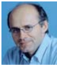
Του Χαρίδημου Κ. Τσούκα*

Ι σως πρόκειται για τεχνοκρατική εμμονή, αλλά δύσκολα μού βγάζει κανείς από το μυαλό ότι το πλέον δυσεπίλυτο πρόβλημα αυτής της χώρας είναι η οργάνωση και διοίκηση. Δεν είναι τόσο απλό, όσο ενδεχομένως ακούγεται. Η οργάνωση και διοίκηση, δεν είναι απλώς συστήματα και διαδικασίες. Κυρίως είναι πρακτικές και νοοτροπίες, οι οποίες εμπλέκουν ανθρώπινες συμπεριφορές, οι οποίες με τη σειρά τους, νοηματοδοτούνται από ευρύτερες αξίες και μορφοποιούνται από κοινωνικώς αποδεκτά συστήματα κινήτρων και τιμωριών.