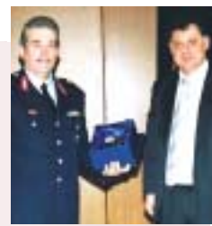
Ο Πρόεδρος της Ένωσης, Αστυνομός Β. κ. Μιχαήλ Σεβδωνίδης απονέμει την πλακέτα για τη Γενική Αστυνομική Διεύθυνση Περι. Ανατ. Μακεδονίας & Θράκης, στον Υποστράτηγο κ. Χρήστο Νικολόπουλο

Μ ε εξαιρετική επιτυχία πραγματοποιήθηκε στην Κομοτηνή η 14η Ετήσια Τακτική Γενική Συνέλευση της Ένωσης Αξιωματικών Ελληνικής Αστυνομίας Ανατολικής Μακεδονίας - Θράκης.