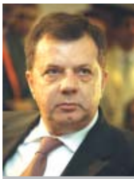
Ο κ. Παναγιώτης Χηνοφώτης

Α κρογωνιαίος λίθος για την επιτυχία των δομικών αλλαγών και της αναδιάρθρωσης της Αστυνομίας, σύμφωνα με τον υφυπουργό Εσωτερικών Παναγιώτη Χηνοφώτη, είναι η αλλαγή νοοτροπίας των ίδιων των αστυνομικών. Αυτό τονίζει σε συνέντευξή του στον «Κόσμο του Επενδυτή» (Μάιος 2008), ο κ. Χηνοφώτης, στην πρώτη εφ' όλης της ύλης συνέντευξή του, προαναγγέλλοντας σημαντικές τομές σε θεσμικό επίπεδο. Στο ερώτημα με ποια μέτρα θα κινητοποιηθεί το σύνολο της αστυνομικής δύναμης απαντά: «Θεωρώ ότι το ανθρώπινο δυναμικό είναι αξιολογούμενο από πλευράς